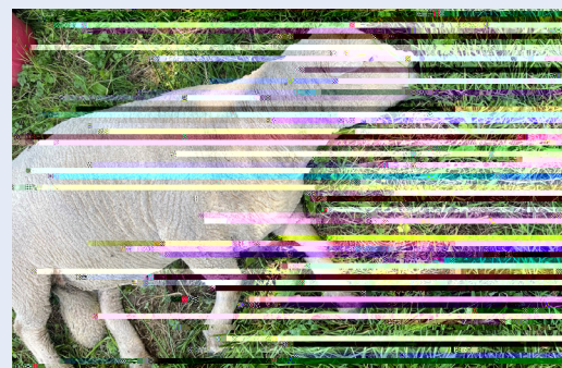
Anifail yn methu codi

Darganfyddwch fwy o wybodaeth a sut i adrodd am y tafod glas drwy ymweld www.gov.wales/bluetongue