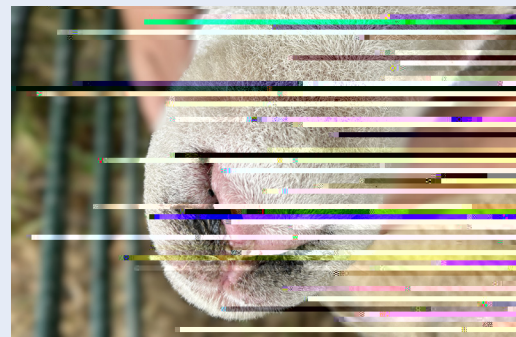
Cochni yn y trwyn